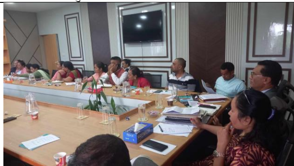
योजना तर्जुमा गोष्ठीको छलफल सत्र