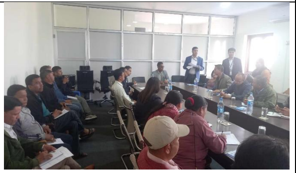
योजना तर्जुमा गोष्ठीको विषयगत समिति छलफल