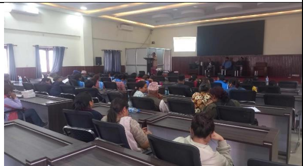
आवधिक योजनाको मस्यौदा प्रस्तुतीकरण कार्यशाला