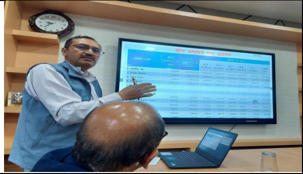
योजना तर्जुमा गोष्ठीको विषयगत समिति छलफल