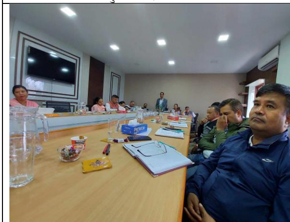
योजना तर्जुमा गोष्ठीको छलफल सत्र