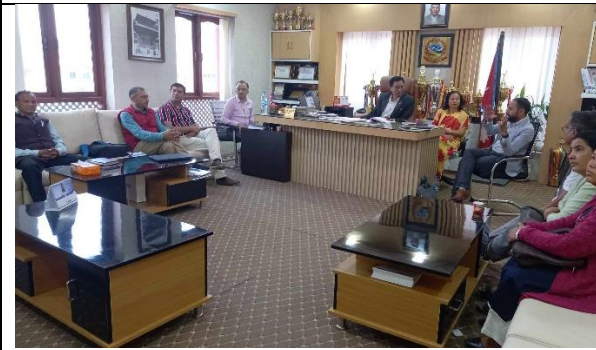
आवधिक योजनाको मुख्य विषयवस्तु माथि प्रमुख पदाधिकारीको छलफल