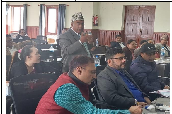
आवधिक योजना तर्जुमामा सहभागी प्रतिक्रिया व्यक्त गर्दै