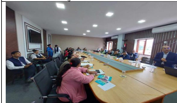
योजना तर्जुमा गोष्ठीको छलफल सत्र