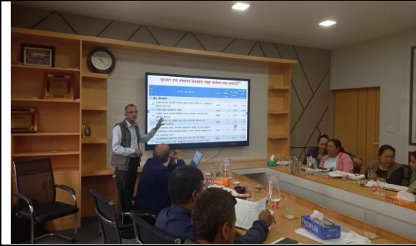
योजना तर्जुमा गोष्ठीको विषयगत समिति छलफल