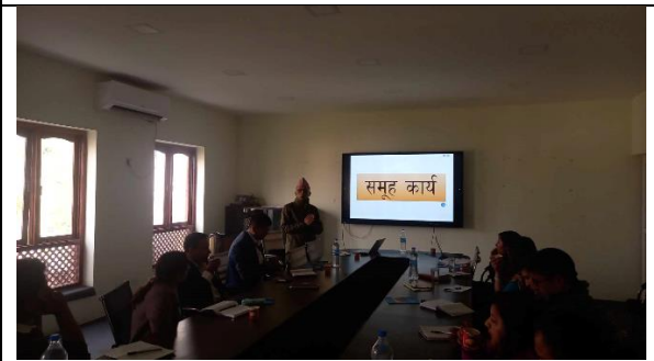
योजना तर्जुमा गोष्ठीको विषयगत समिति छलफल