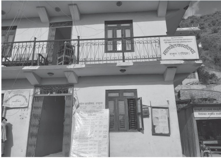
रुकुमपश्चिमको मालपोत कार्यालय ।

मुसीकोट समाचारदाता रुकुमपश्चिम, फागुन १६ गते